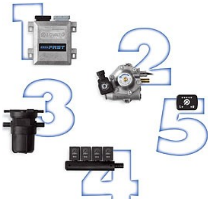
Schéma instalace ve vozidle

Systém sekvenčního vstřikování LPG je koncipováno pro motory od 3 do 8 válců včetně vozidel turbo a valvetronic. Komponenty jsou navrženy tak aby zabíraly co nejméně místa a přitom jejich instalace byla co nejsnadnější. Všechny komponenty jsou na velmi vysoké úrovni spolehlivosti a s tím i spojená spokojenost konečného uživatele. Nastavování systému je velmi jednoduché a probíhá automaticky.